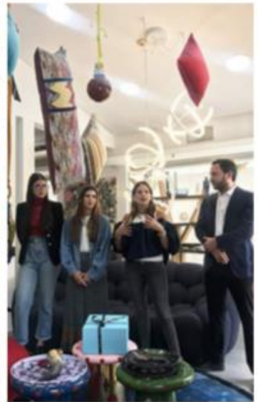
Durante la entrega del premio a la mejor vitrina