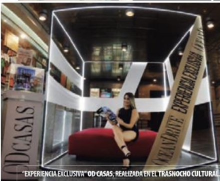
"EXPERIENCIA EXCLUSIVA" OD CASAS, REALIZADA EN EL TRASNOCHO CULTURAL