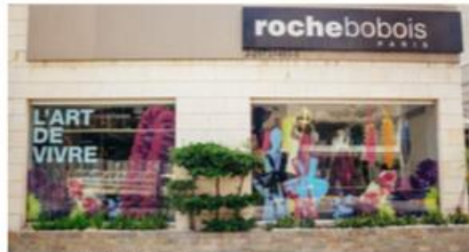
La vitrina de Roche Bobois, la ganadora